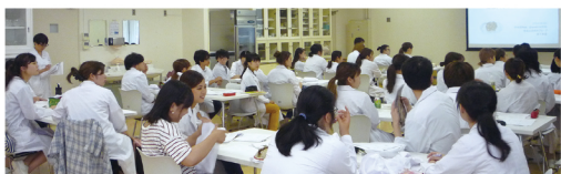
プロから講義を受ける生徒、食物栄養科の生徒は真剣でした。

国産キムチと韓国キムチの食比べ、「やっぱり、本場は辛い」「白ご飯がほしいです」とワイワイ。